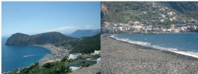
Spiaggia di Canneto, isola di Lipari

Gaston Vuillier, LA SICILE. IMPRESSIONS DU PRESENT E DU PASSE', 1896