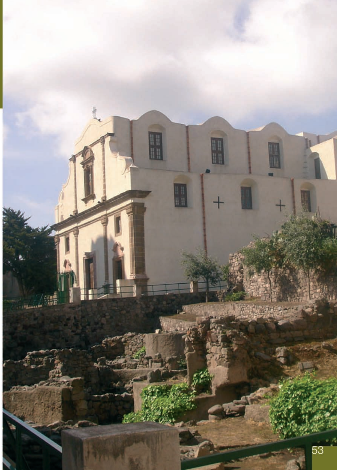
Chiesa dell'Addolorata, isola di Lipari