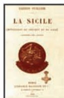
Gaston Vuillier, LA SICILIA. IMPRESSIONI DEL PRESENTE E DEL PASSATO, F.lli Treves Milano 1897